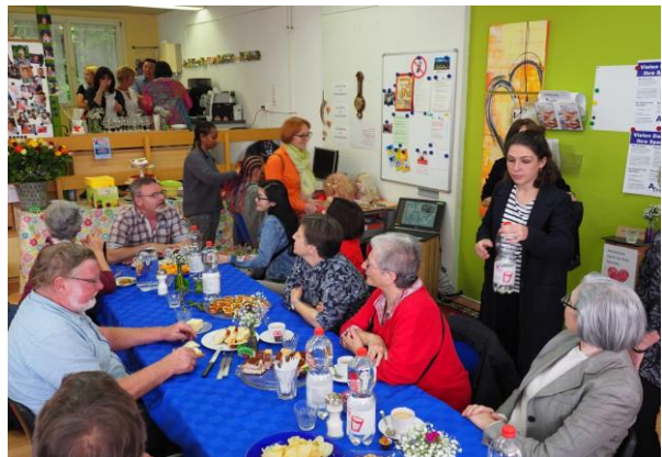
Viele Besucher nutzten den Tag der offenen Tür, um das 10-jährige Jubiläum zu feiern – es war ein schöner Anlass.

An dieser Stelle sei allen Unterstützerinnen und Unterstützern herzlich gedankt. Durch ihre verlässlichen und grosszügigen Spenden oder auch durch ihr grosses persönliches Engagement ermöglichen Sie den Betrieb des A-Treffs seit mittlerweile 10 Jahren. Vielen herzlichen Dank!!!