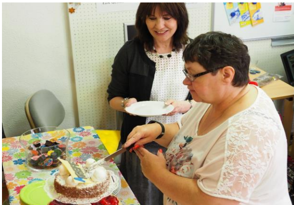
10 Jahre A-Treff: ein Grund zu feiern! Die Jubiläumstorte wird angeschnitten.

Im Jahr 2019 durfte der A-Treff das 10-jährige Bestehen feiern. Dieses Jubiläum wurde am 18. Mai 2019 mit einem Tag der offenen Tür begangen. Viele Menschen nutzten dabei die Gelegenheit, zum A-Treff zu kommen, um das Jubiläum gebührend zu feiern oder einen Blick hinter die Kulissen zu werfen und sich vor Ort zu informieren.