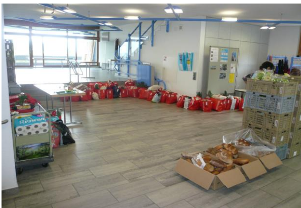
Über mehrere Wochen hinweg wurde die Lebensmittelabgabe im Kirchgemeindehaus in Balgach durchgeführt.

Für das kommende Jahr 2021 mit seinen grossen Unwägbarkeiten wird an diesen bestens funktionierenden Abläufen festgehalten, solange die Situation mit Covid 19 dies erfordert. Gerne kehren wir sobald wie möglich wieder zur Normalität zurück.