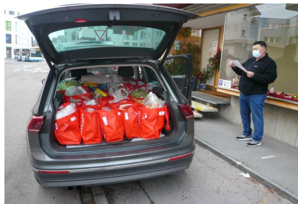
Seit dem Herbst werden die Lebensmittel per Lieferservice verteilt.